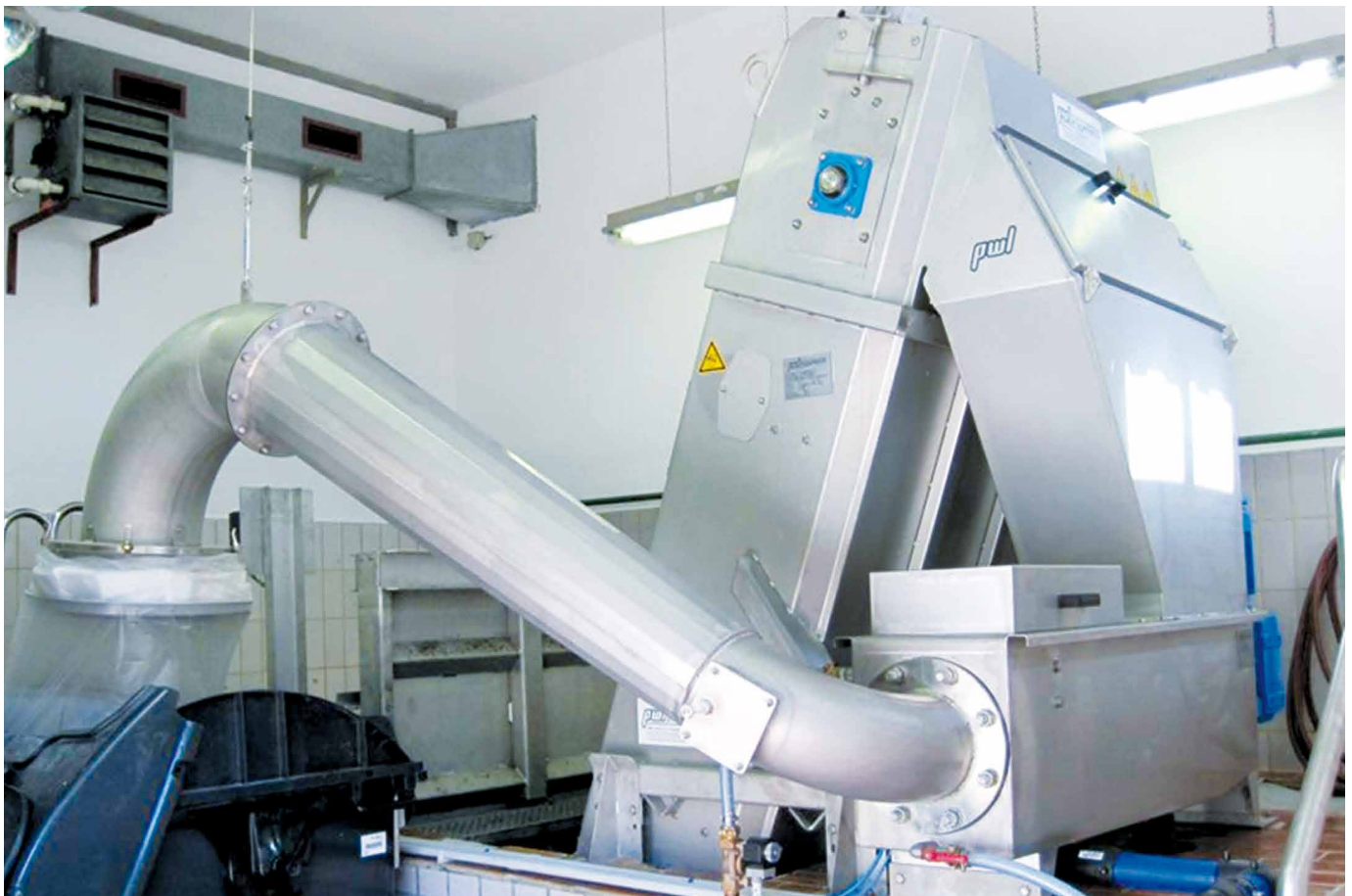
Stand: 4/2017 (Technische Änderungen vorbehalten)

Nach dem Waschvorgang gelangt das Rechengut in die Presszone und wird dort verdichtet und ausgetragen. Die löslichen organischen Stoffe werden zusammen mit dem Waschwasser wieder in das Gerinne zurückgeleitet. Das Austragsrohr mit integrierter Presszonenverstellung kann optional mit einer Hygienekapselung ausgestattet werden.